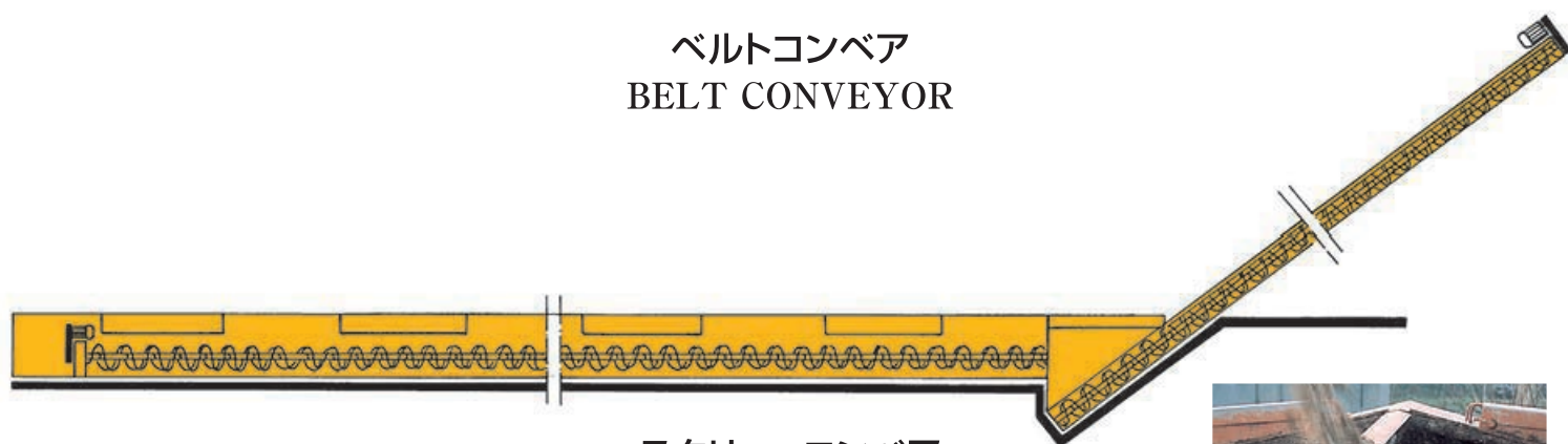
スクルーコンベア SCREW CONVEYOR